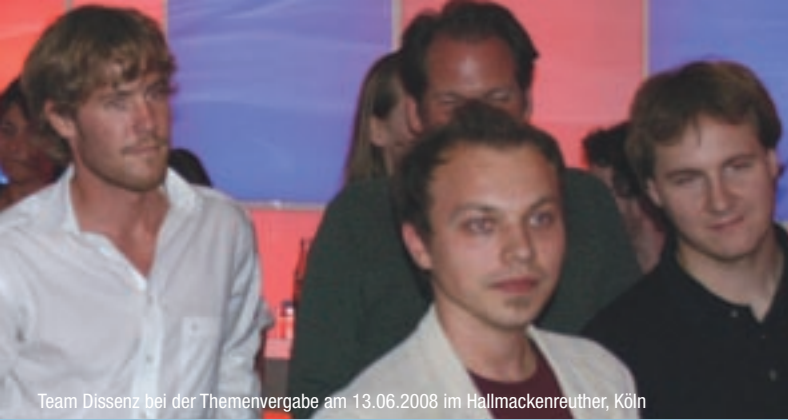
Team Dissenz bei der Themenvergabe am 13.06.2008 im Hallmackenreuther, Köln